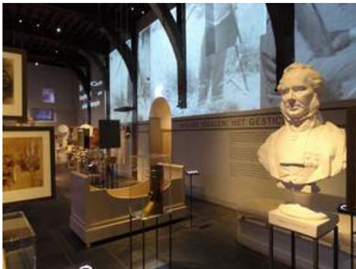
im Psychiatrie Museum