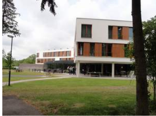
De Baasis (Tagungshaus in Doorn bei Utrecht/ NL)

Thema: Internationaler Vergleich der Sterberaten in ausgewählten Anstalten 1940-1945 und mögliche Implikationen für aktuelle ethische Fragen