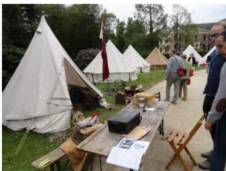
Im Park: ein historisches Fest...