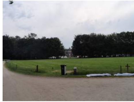
Vor dem Haus befindet sich ein großer Park