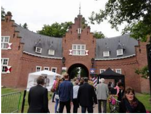
Eingang zum Gelände "Haus Doorn"