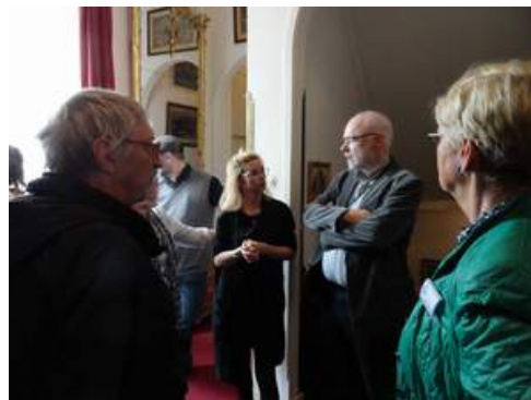
Führung durch das Haus