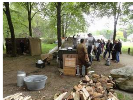
... aus der Zeit des 1. Weltkrieges