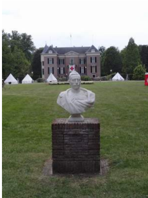
Büste von Wilhelm II.