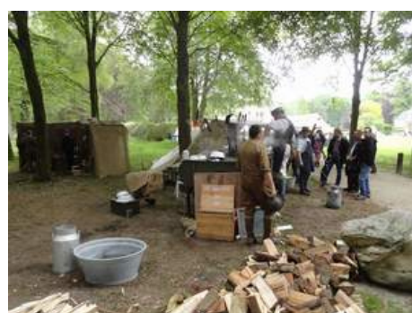
... aus der Zeit des 1. Weltkrieges