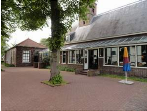
Het Dolhuys (Psychiatrisches Museum in Haarlem/ NL)

vom 20.5.- 22.5.2016 in Het Dolhuys (Haarlem) und De Baasis (Doorn) / Niederlande